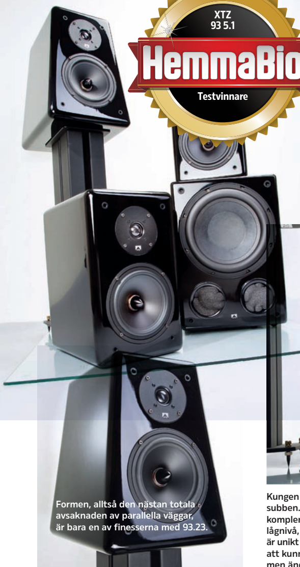
Formen, alltså den nästan totala avsaknaden av parallella väggar, är bara en av finesserna med 93.23.